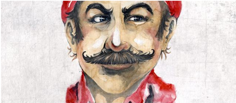
Super Mario i närbild.

Besök på Datamuseet IT-ceums spelkonstutställning.