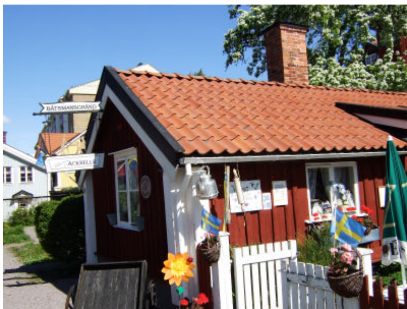
Ackrells kafé. 21 personer fikade i den del av byggnaden som fastnat på fotot.