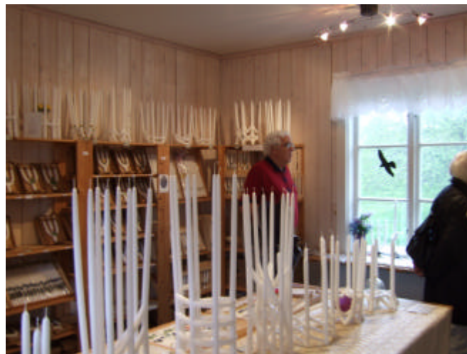
Handstöpta ljus från Gränsö ljusstöperi.

När vi lämnade Gränsö slott tornade dramatiska moln upp sig, precis som SMHI hade spått. En hel del har blivit bättre genom åren.