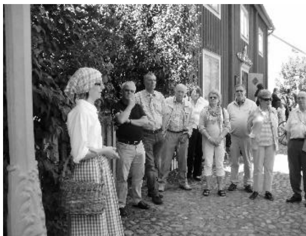
Guiden i Gamla Linköping berättar.

Efter lunch på Restaurang Konsert & Kongress fortsatte vi med ett besök i Gamla Linköping. Där gick vi en tur med en kunnig guide. Besöket i ÖeB-bankens museum vid torget var naturligtvis särskilt intressant för våra gäster och föranledde många frågor och kommentarer.