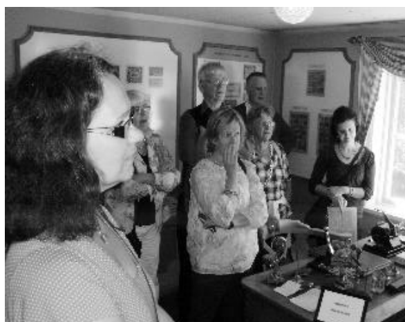
Bankmuseum i Gamla Linköping

Eftermiddagskaffet intogs på Dahlbergs Kafé och därefter begav vi oss till Flygvapenmuseum. Besöket toppades av att vår guide var en av dem som varit med och sökt efter de försvunna planen 1952. Det gav lite extra krydda åt berättelsen där vi stod bredvid vraket av DC-3:an.