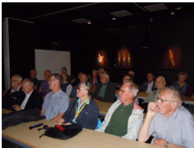
Några lyssnande och fascinerade åhörare.